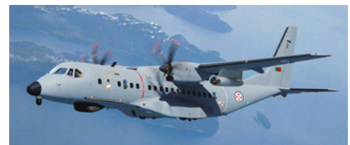
Der Mehrzwecktransporter C295 VIMAR

Die sich optimal ergänzenden Kompetenzen der Konzern-Geschäftsbereiche machten SCHOTT Advanced Optics zum Partner der Wahl. Insgesamt werden 5 Bullaugen aus synthetischem Quarzglas geliefert, die in die Druckkabinenflugzeuge des Typs C295 VIMAR PG03 eingebaut werden sollen.