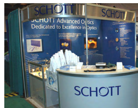
Der SCHOTT-Messestand auf der diesjährigen Optifab

Die Vorträge der Konferenz zum Thema Fortschrittliche Technologien reichten von Verbesserungen bei MTF-Tests, über Lösungen für Polymerbeschichtungen, piezoelektrische Energy Harvester auf MEMS-Basis, und Ionenstrahl-Feinkorrektur (IBF) für Oberflächen von Hochleistungsoptiken bis 700 mm Durchmesser, bis hin zu Beschichtungen mittels reaktivem Puls-Magnetron-Sputtern.