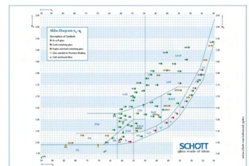
Das aktualisierte Abbe-Diagramm zeigt die Lage aller verfügbaren Gläser

SCHOTT empfiehlt generell, für neue optische Designs nur Glastypen aus dem Standardsortiment zu verwenden.