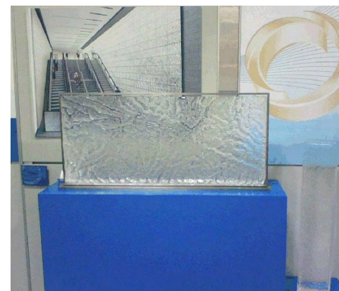
Ein nach Wunsch und in Kooperation mit einem Künstler gegossenes und bearbeitetes Glasteil für ein großes Architekturprojekt in New York

Wenn Sie Künstler sind und nach dem perfekten Glas für Ihr Projekt suchen, wenden Sie sich bitte an einen SCHOTT-Vertriebsmitarbeiter vor Ort, oder senden Sie eine E-Mail an: frank.kost@us.schott.com